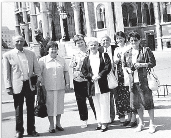
Parlamenti látogatás munkatársakkal (2000.)

mély szépségét tapasztalták meg általa. Minden osztálytárrsal élete végéig ápolta a baráti kapcsolatokat.